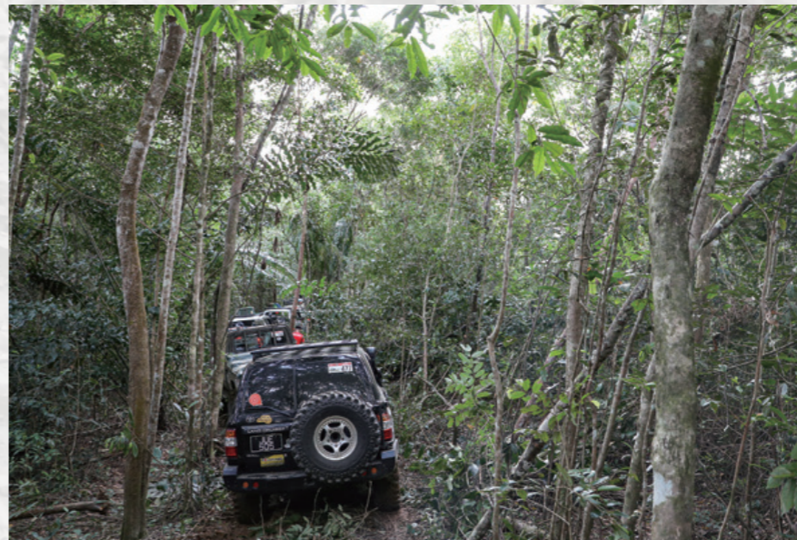
前後左右、樹木しか見えないジャングルをひたすら進む。時折ジャングルジャムが発生するが、メンバーはお茶を飲むなどジャングルでの時間を楽しんでいる。