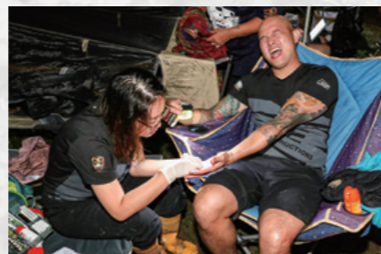
各コンボイには、サバ州立大病院やクイーンエリザベス病院に籍を置く医師や看護師などが帯同している。画像では女医さんがトゲを抜いているだけなのでご安心を。

ディションリーダーのアンソニー氏から連絡が入る。高ぶる気持ちを抑えつつコンボイについて行くと、村の集会所で全車停止。ここではボルネオサファリのメディカルスタッフが無料で村の人々を診療していた。ボルネオサファリが持つもうひとつの側面が、このような過疎地でのボランティアやチャリティ、そして災害復興支援などの活動なのだ。