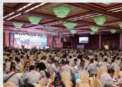
ボルネオサファリ8日目の夜に開催されるクロージングディナーは、1,200人を超える参加者が大集結する壮大なパーティー。表彰式も兼ねており、深夜まで続く。