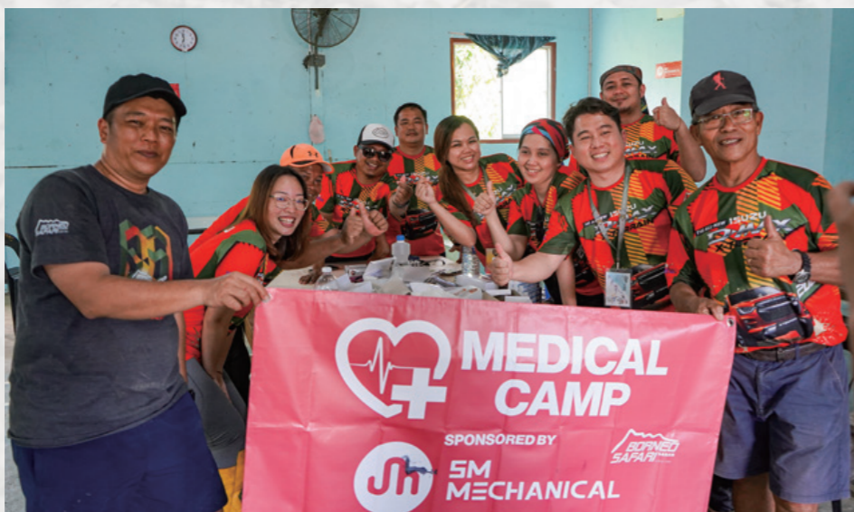
ボルネオサファリでは、コンボイ移動中に過疎地の村に立ち寄り、メディカルチームによるボランティア活動も行っている。