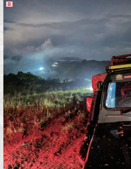
⑤ハードコアルートは、長年の放置で道が樹木で塞がれているため、皆で道を切り開きながらコンボイを前進させる。⑥バンジージャンプと名付けられたスリッピなダウンヒルは、幅が広く車体が横を向くと横転間違いなし。⑦マッドなハードコアだったが、我々のジムニーは「スーパージムニー」と呼ばれ、走破性の高さをメンバー達に見せつけた。⑧日没後もスタックに次ぐスタックでキャンプ地にはなかなか辿り着けない。