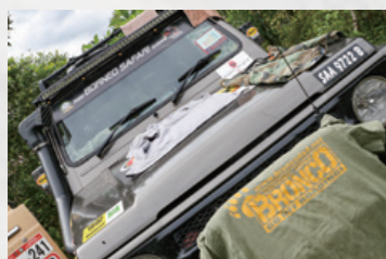
なかなか晴れ間が出なかったため、休憩時間を利用して川で洗濯した生乾きの衣類を干す。